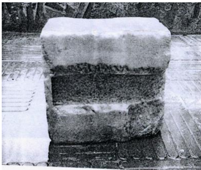
Рис. 3. Постамент наместника Митридата VI Евпатора из Ольвии, нижняя поверхность.